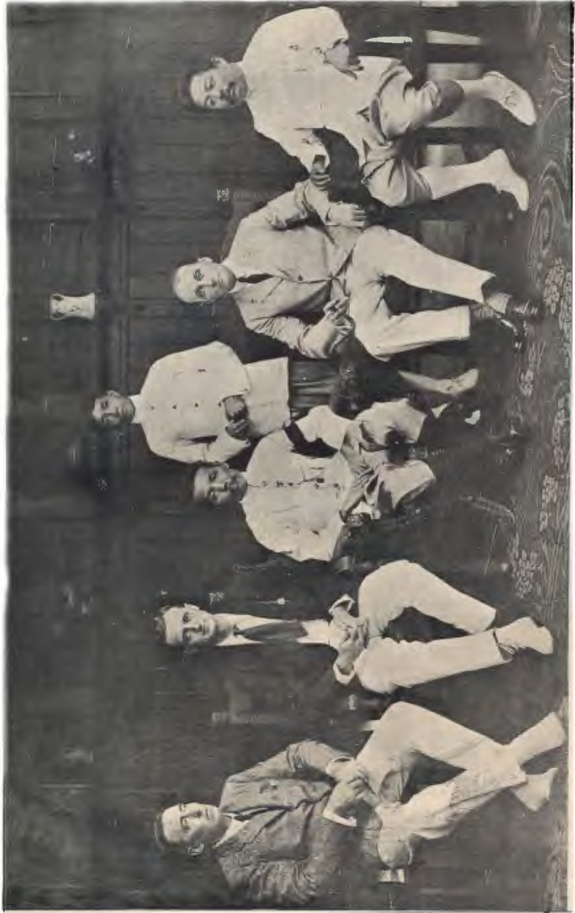
กรรมการตรวจรายจ่ายแผ่นดิน ศก ๓๓๑