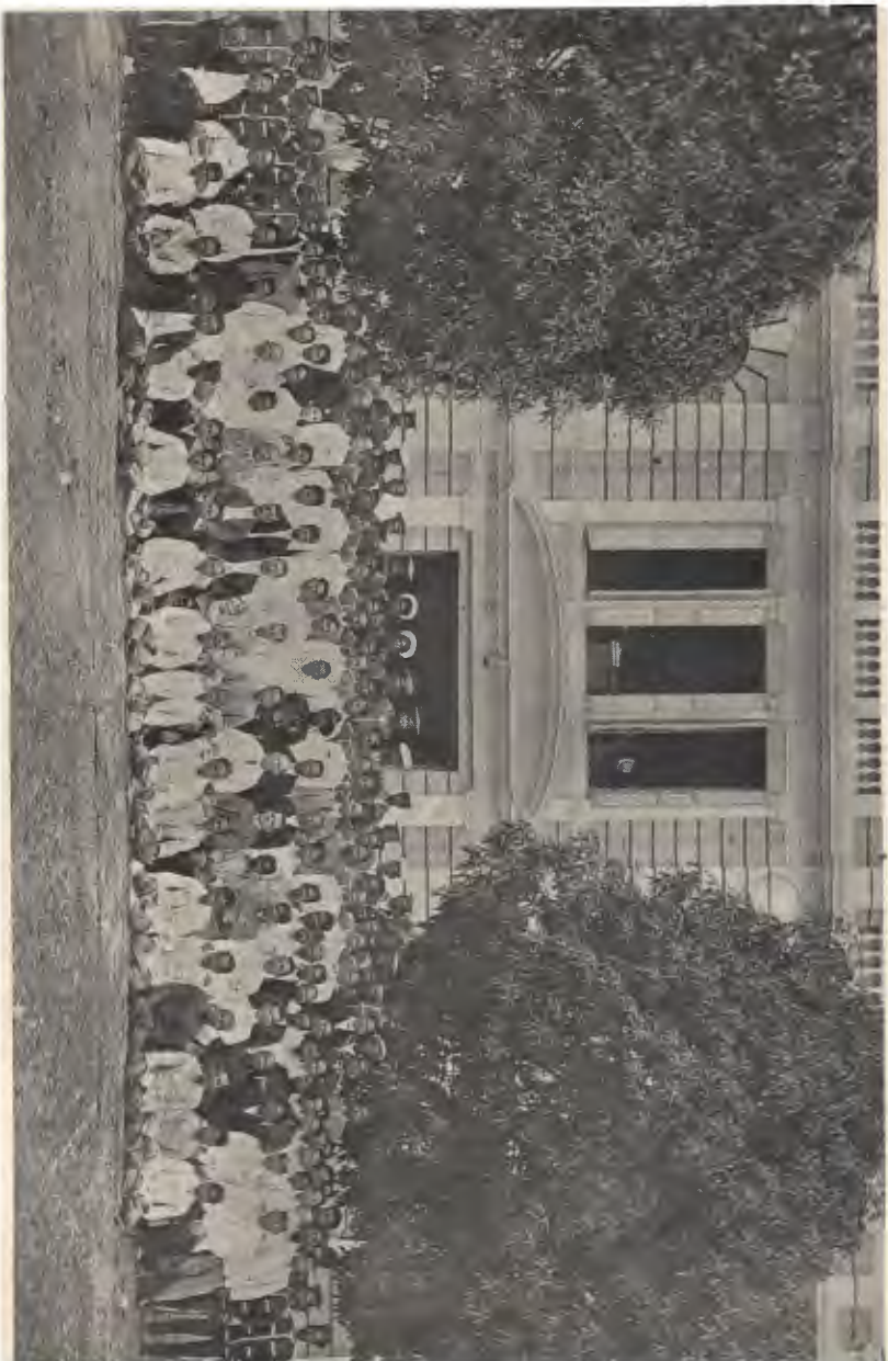
ພ້າງາທການກຸມສຸດທານ ເມື່ອວາງ ພ.ສ. ໒໔໔໓