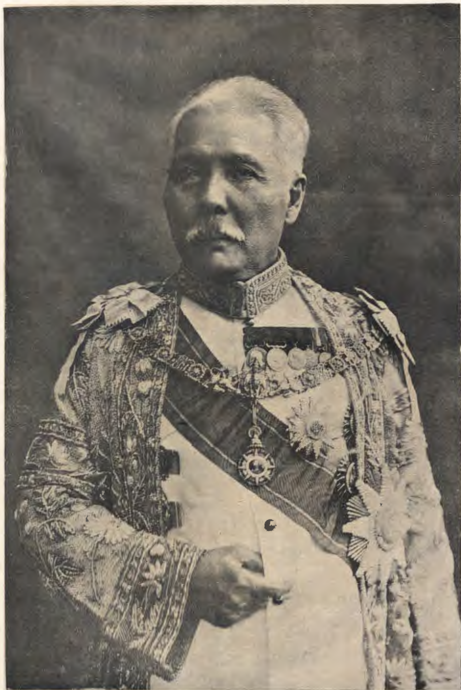
พระวรวงศ์เธอ พระองค์เจ้าพร้อมพงศ์อิธราช